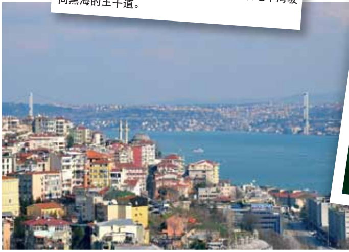
黑海 - 博斯普鲁斯海峡大桥是邮轮船舶从地中海驶向黑海的主干道。