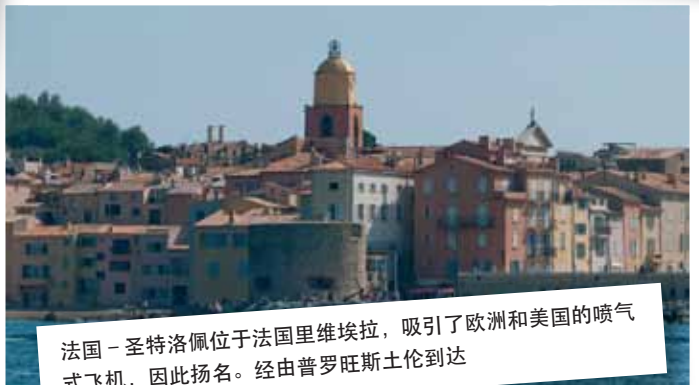
法国-圣特洛佩位于法国里维埃拉，吸引了欧洲和美国的喷气式飞机，因此扬名。经由普罗旺斯土伦到达