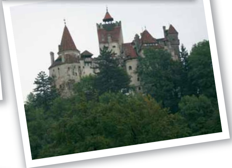
罗马尼亚 - 拜恩古堡，罗马尼亚众多古堡中的一个。是著名的“吸血鬼城堡”。经由康斯坦萨到达