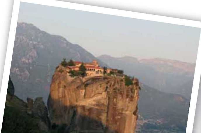
希腊-迈泰奥拉是希腊东正教修道院最大最重要的集聚地。建在天然的砂岩岩柱上。经由沃洛斯到达