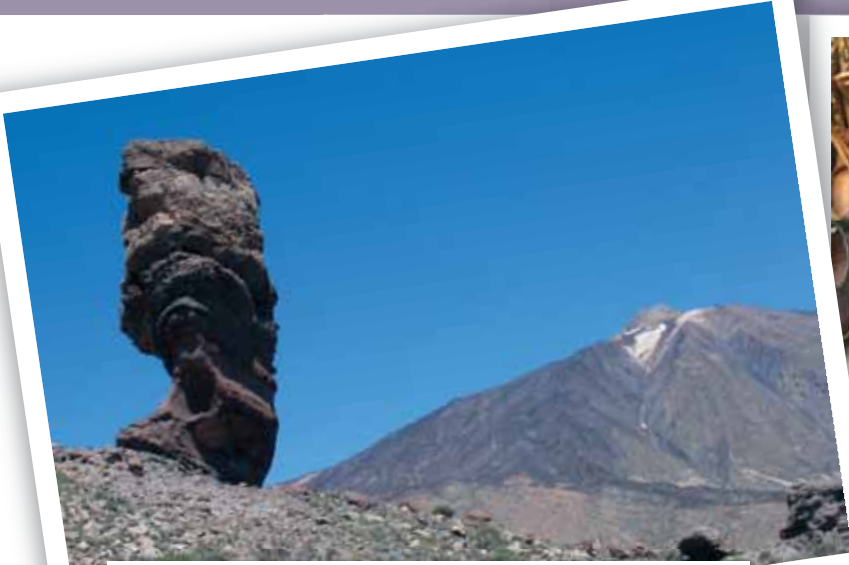
特纳利夫-泰德国家公园以西班牙最高峰、世界第三大火山0泰德山为中心，方圆约3718米，被联合国教科文组织列为世界文化遗产。经由特纳里夫圣克鲁斯到达