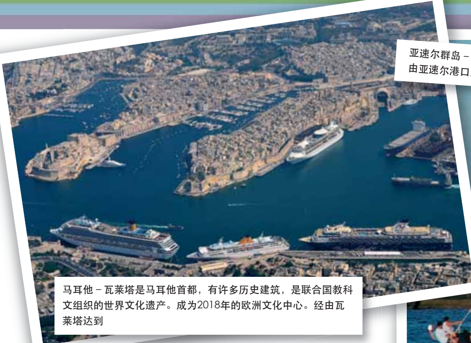
马耳他 - 瓦莱塔是马耳他首都，有许多历史建筑，是联合国教科文组织的世界文化遗产。成为2018年的欧洲文化中心。经由瓦莱塔达到