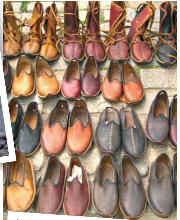
土耳其-土耳其出售大量皮制品，包括绒面服饰。经由土耳其港口到达