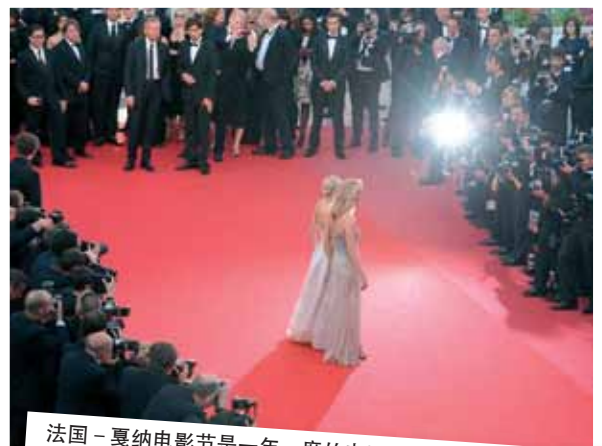
法国 - 戛纳电影节是一年一度的电影盛会，预告所有类型的影片。成立于1946年，是全世界最权威、最受关注的电影节。经由法国里维埃拉的港口到达