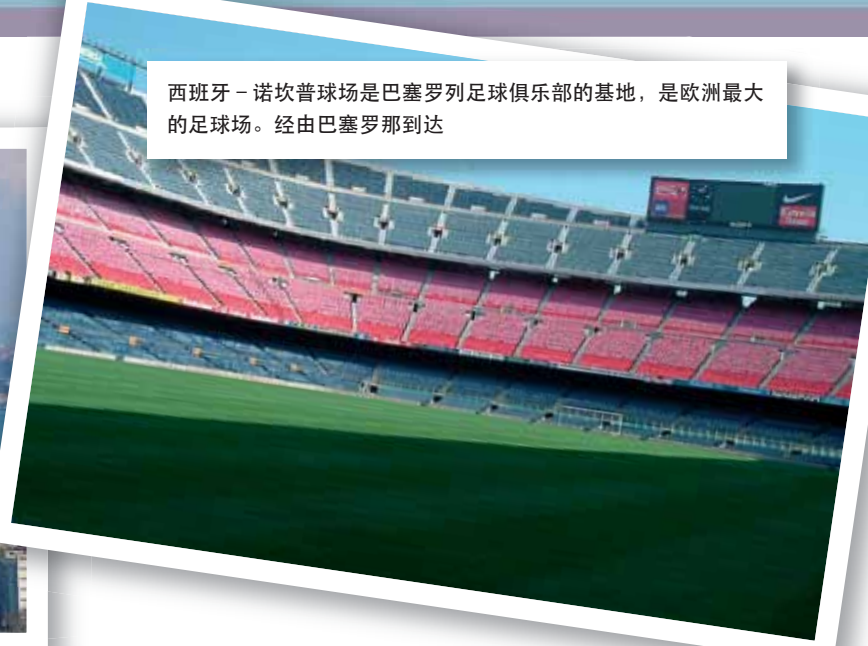
西班牙 - 诺坎普球场是巴塞罗列足球俱乐部的基地，是欧洲最大的足球场。经由巴塞罗那到达