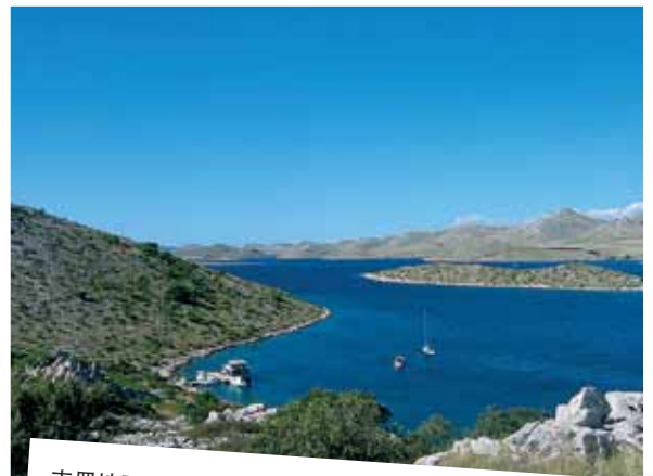
克罗地亚-科纳齐岛国家公园位于达尔马提亚。长35公里，有140座小岛。经由西贝尼克和扎达尔到达