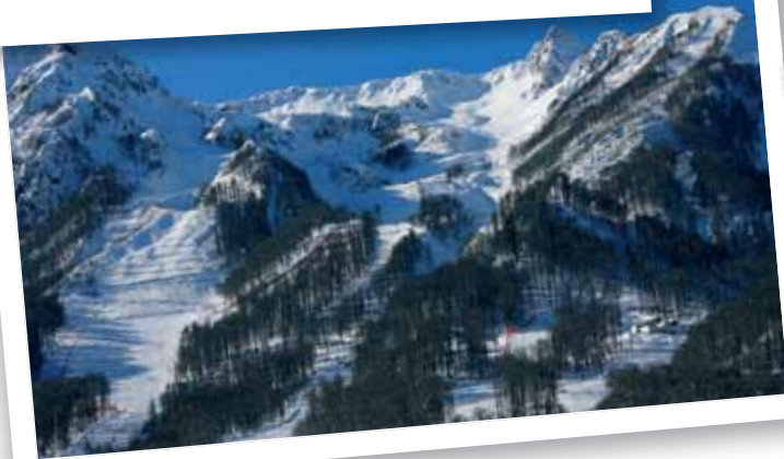
俄罗斯 - 2014年冬季奥运会计划2月在索契举办，一些比赛项目将在卡拉斯拉雅波利亚纳的旅游胜地。经由索契到达